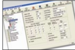
fácil de navegar interfaz visual